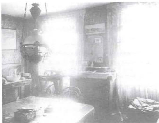
倫敦哈克福街 87 號屋內 (攝於梵高居留期間)